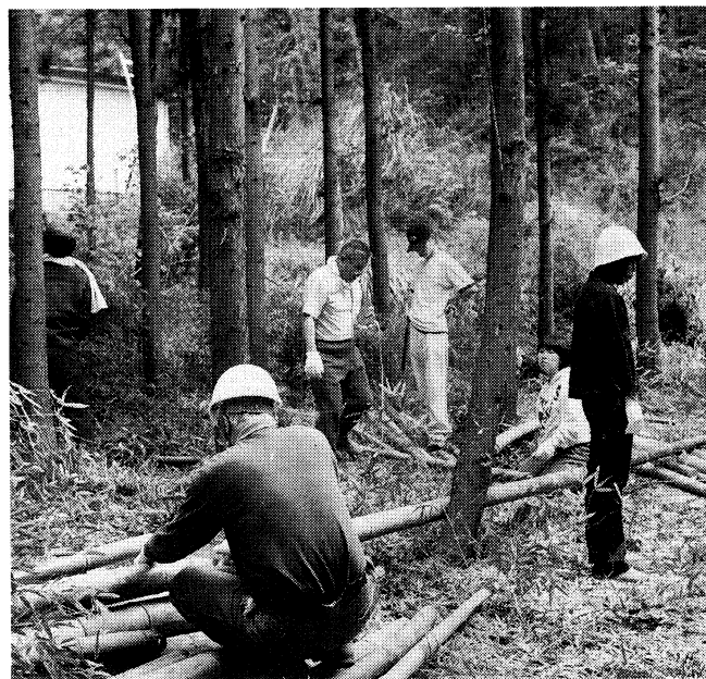
里山整備(竹の除去) 5月 この時は、60人近く参加した