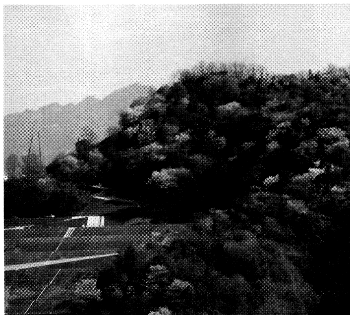
予定地だった里山の山桜 4月 (工業団地の造成地がみえる)

三木町内の、別のゴルフ場では、やはり計画が消えた後、債権者が、30ha(9万坪)を3,000万で売ろうとしています。(買収額は数十億の物件です。国道至近・日当たり良好なのに)まだ買い手がありません。今では、山なんて誰も見向きもしない時代に、再びなったのでしょうか。時代はくり返すのでしょうか?