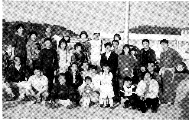
私達の会とオーナーで豊島に行きました。

当たり前のように自然の恩恵を受けている私たち。その自然を破壊するのも、SOSの発信に素早く対応できるのも同じ私たち人間です。これからも感性を鍛え心を失わず、仲間と共にこの地で生きていきます。