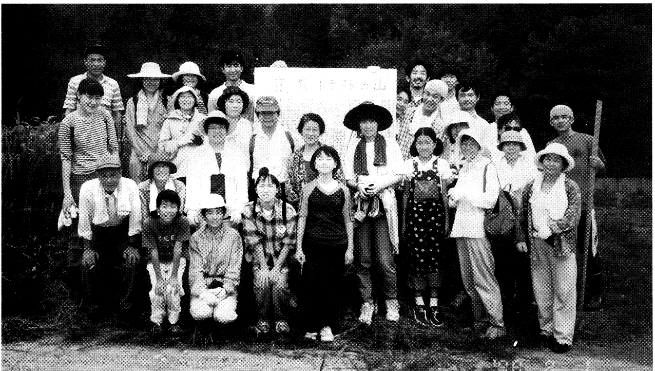
市島の自然と水を守る会（兵庫県）の皆さん（1998.8）