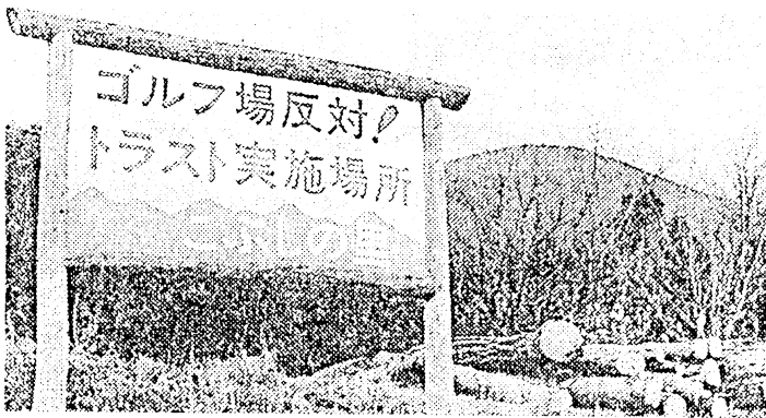
開発中止の引き金となった立木トラストを告げる看板 と白滝山（平成5年12月9日 中国新聞）

さて、私ども「こぶしの里を守る会」は、結成以来十周年を迎え、また、オーナーの皆さんのご協力によって、ゴルフ場をストップさせることができ、立木トラスト契約の期間も満了しますので、平成13年を以て会の解散を予定しています。