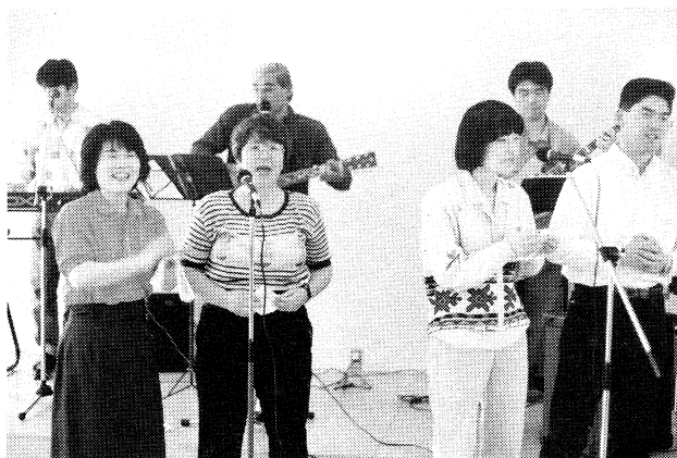
未来の森のテーマソングを歌う“夢企画かたくり”

3月の瀬戸内トラスト・ニュースが届いた頃から少しずつ始め、あの産廃の地に、未来の森が早く出来るよう一針一針に願いをこめ、4月20日のアースデーに間に合うように作りました。「豊島の森を応援する弓削の会のメンバー」と、思い思いの詩を添えて、「アースデーかがわin豊島」にこのような形で参加させていただきました。