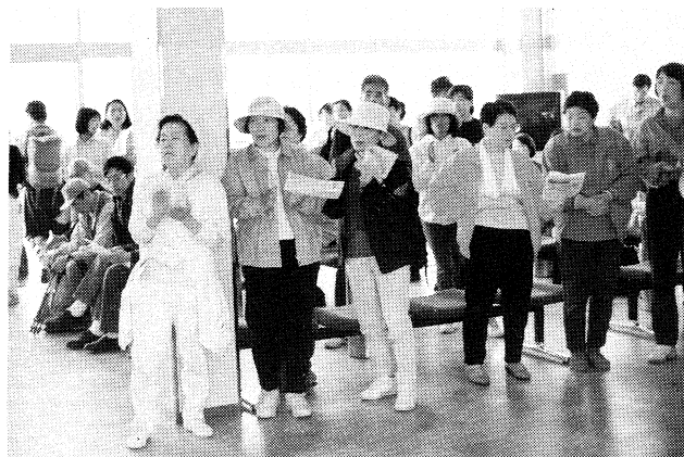
交流センターでいっしょに歌う人たち