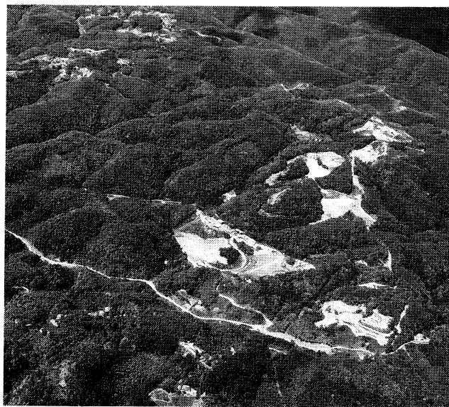
広瀬地域の自然破壊された様子