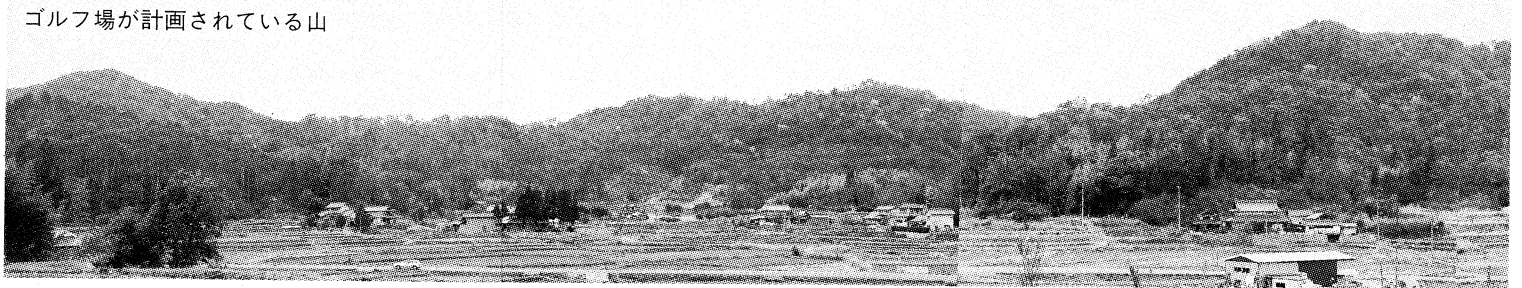
ゴルフ場が計画されている山