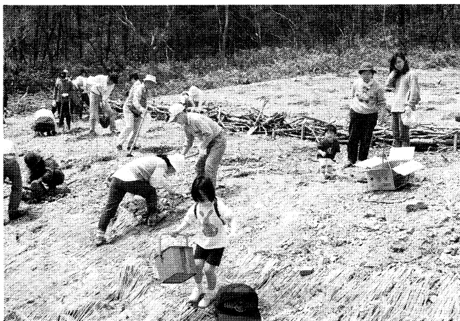
広島県吉和村の植樹風景 (4月20日森と水と土を考える会) 中国山地の広葉樹林の再生を