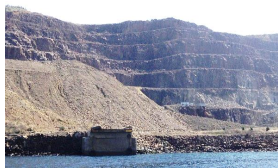
長崎県交渉の様子(写真上)と、 杵島土砂搬出予定地