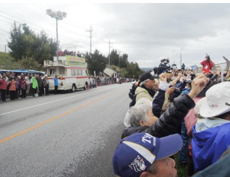
キャンプシュワブの前で開かれた県民集会には3500人余が参加した