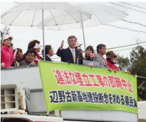
「埋め立て承認の撤回をやる」と表明する翁長知事